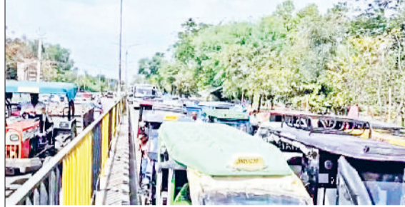
जींद। जाम में फंसे वाहन।