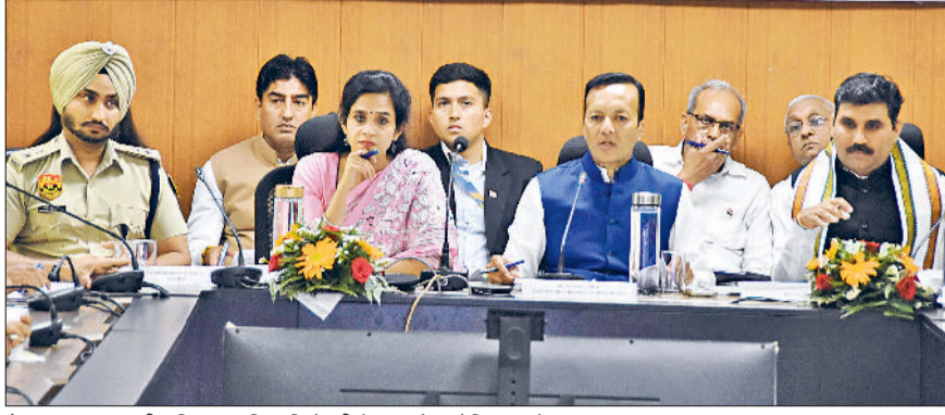
कैथल। सांसद नवीन जिंदल अधिकारियों की बैठक को संबोधित करते हुए।

रहा कि पात्र व्यक्तियों तक योजनाओं का लाभ प्रभावी ढंग से पहुंचे। इस दौरान पिछली बैठक में दिए गए निर्देशों पर की गई कार्रवाई की रिपोर्ट भी प्रस्तुत की गई। बैठक के दौरान सांसद नवीन जिंदल ने कहा कि सभी विभागों के अधिकारी आपसी तालमेल के साथ कार्य करें। फील्ड में जाकर