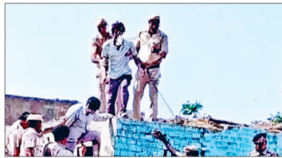
जौड़। ईट फेंकने वाले व्यक्ति को हिरासत में लेते हुए पुलिस।