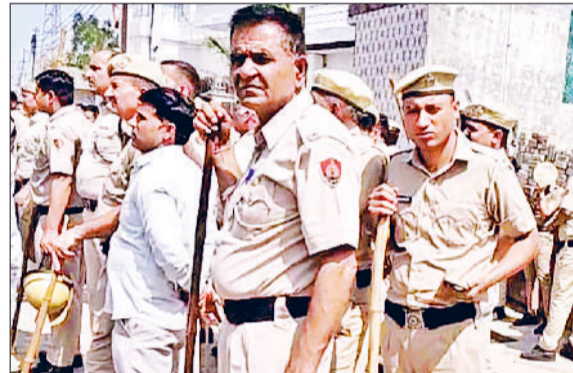
जौड़। अवैध निर्माण गिराने के दौरान तेनात पुलिस।

ग्राम पंचायत के बाद हाईकोर्ट में गांव का ही एक व्यक्ति लगातार पैरवी कर रहा था।