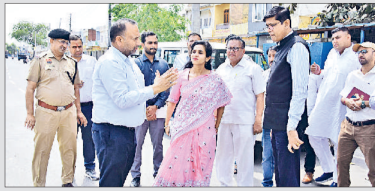
कैथल। मुख्यमंत्री के अतिरिक्त प्रधान सचिव डॉ. साकेत कुमार अनाज मंडी का दौरा करते हुए।

मुख्यमंत्री के अतिरिक्त प्रधान सचिव डॉ. साकेत कुमार शुक्रवार को अनाज मंडी कैथल में अधिकारियों को बैठक को संबोधित कर रहे थे। बैठक के बाद उन्होंने मंडी का दौरा भी किया। साथ ही आढ़तियों की समस्याएं भी सुनीं। उन्होंने गेहूँ खरीद की तैयारियों की बारीकी से समीक्षा की। इस दौरान डीसी अपराजिता व अन्य संबंधित अधिकारी मौजूद रहे। उन्होंने कहा कि सभी उपकरणों को समयबद्ध दुरुस्त करवाएं। इस कार्य में कोई भी लापरवाही न बरती जाए। गेट पास के बारे में बारीकी से जानकारी प्राप्त ली। जिसमें नए प्रावधान के तहत मंडी में प्रवेश के समय किसानों की फोटो खिंचने से लेकर बायोमीट्रिक तक एवं बाद में एजेंसी के रिकॉर्ड में डब्लूज तक की पूरी प्रक्रिया की बारीकी से समीक्षा की। इन विभिन्न चरणों में आवश्यक संसाधनों प्रिंटर, नमी मापने के यंत्र, बारदाना, कर्मचारियों की संख्या, गोदामों में खाली जगह, डिजिटल धर्मकांठों सहित सभी तरह के स्टॉक के बारे में जानकारी ली और आवश्यक निर्देश जारी किए। उन्होंने कहा कि पूरी प्रक्रिया इतने सरल तरीके से हो कि किसानों को कोई परेशानी न हो।