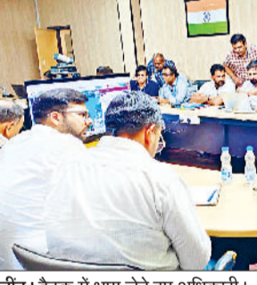
जीद। बैठक में भाग लेते हुए अधिकारी।