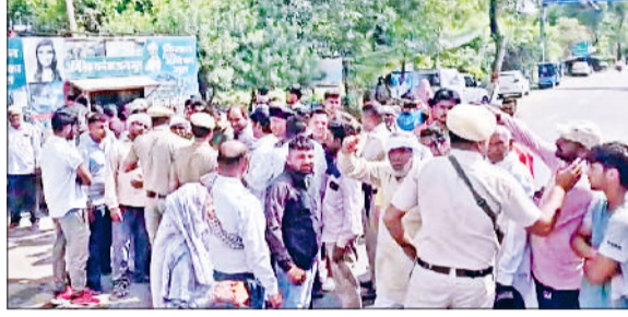
जींद। गोहाना रोड पर जाम लगाए उपभोक्ता।