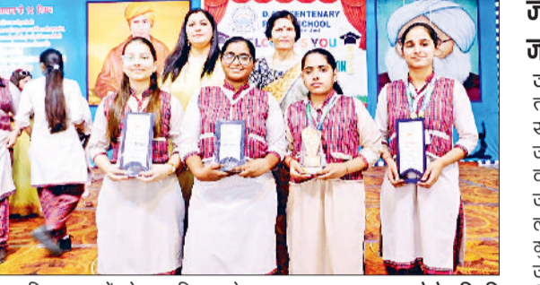
जीद। प्रतिभावन बच्चों को सम्मानित करते हुए।

जैसे बड़े औद्योगिक शहरों से मजदूरों का पलायन शुरू हो गया है। क्योंकि उनके सामने परिवार की रोजी रोटी का संकट खड़ा हो गया है। उन्होंने कहा कि भारतीय मजदूर संघ हरियाणा सरकार से मांग करता है कि सरकार उद्योगों को चलाने के लिए पर्याप्त गैस एवं पेट्रोलियम पदार्थों की व्यापक उपलब्धता सुनिश्चित करें और इंटोनी ग्रस्त एवं पलायन करने वाले मजदूरों को आपातकाल स्थिति मानकर उनकी आर्थिक सहायता करें ताकि मजदूरों को रोजी रोटी के संकट से बचाया जा सके।