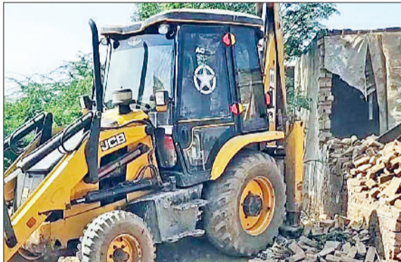
जौड़। अवैध निर्माण गिराते हुए जेसीबी मशीन।

गांव भाणा ब्राह्मणन में पंचायत ने तालाब की पंचायती जमीन को अवैध निर्माणों को लेकर अदालत में याचिका की थी। मामला हाईकोर्ट में चला हुआ था। हाईकोर्ट ने पंचायत के पक्ष में फैसला देते हुए जिला प्रशासन को कब्जा मुक्त करवाने के आदेश दिए थे। अवैध