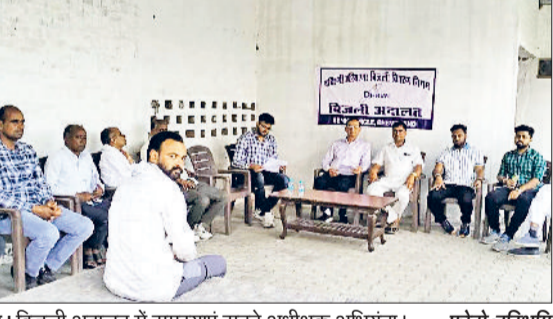
जीद। बिजली अदालत में समस्याएं सुनते अधीक्षक अभियंता।